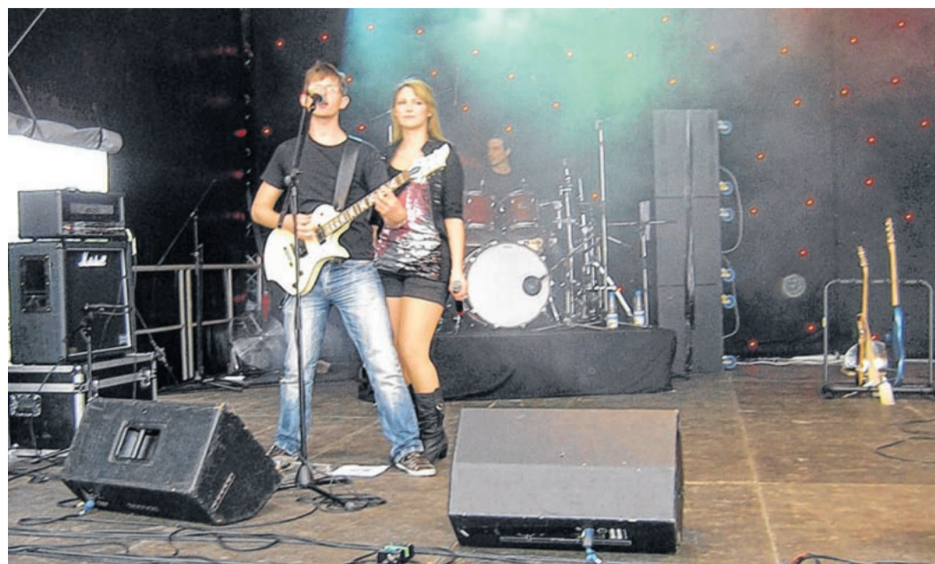
Auf dem Haigern treten bekannte regionale Bands und Musiker auf. Die Künstler spielen kostenfrei. Die Einnahmen kommen einem guten Zweck zugute. Viele der Band-Bewerbungen mussten abgelehnt werden.